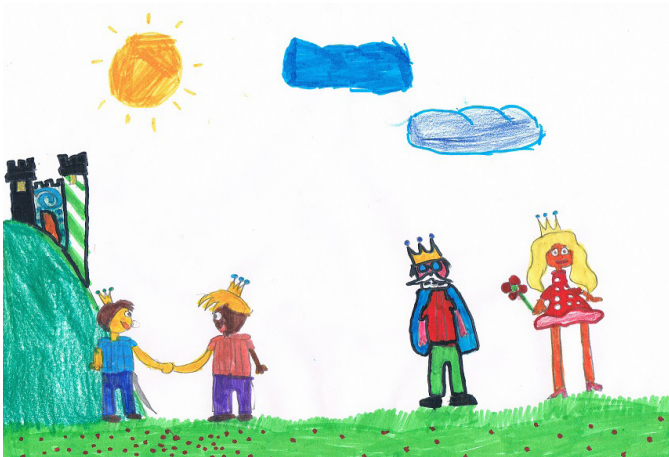
Ilustración: Aitor Moreno (9 años)

-¿Por qué me arrebatas la bolsita? ¡yo la vi primero!-